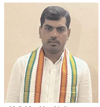
గారిని నియమించడం జరిగింది.