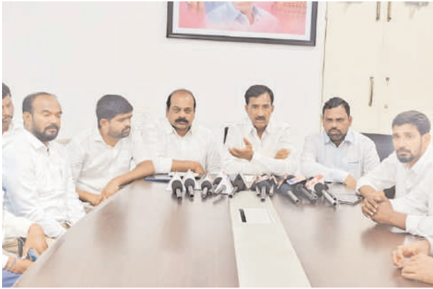
గజ్వేల్, ఆగస్టు 29, మనం న్యూస్: గజ్వేల్ నియోజకవర్గ అభివృద్ధిని అడ్డుకుంటున్న కాంగ్రెస్ను ప్రజలు తరిమికొట్టడం ఖాయమని ఎఫ్డీసి చైర్మన్ వంటేరు

-ప్రాజెక్టుల నిర్మాణంతో రైతుల్లో భరోసా నింపిన కేసీఆర్