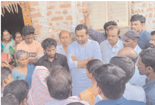
విఆర్ఎ కుటుంబాన్ని పరామర్శించిన ఎమ్మెల్యే