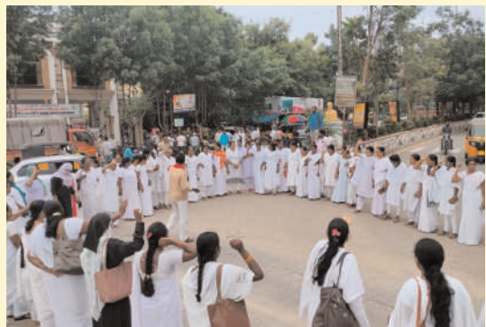
మానవహారంతో సెకండ్ ఏఎన్ఎంల నిరసన