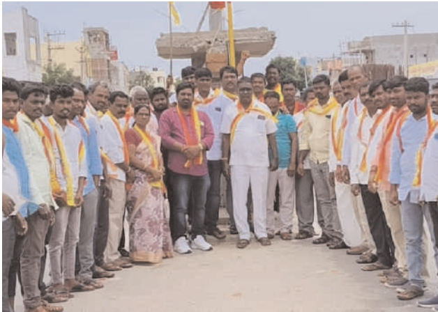
గజ్వేల్, ఆగస్టు 24, మనం న్యూస్: శాసనసభ సభ్యులుగా ఎమ్మెల్యే అభ్యర్థుల జాబితాలో ఒక్క ముదిరాజ్ అభ్యర్థి లేకపోవడం చాలా బాధాకరమని, ఇందుకు గాను బిఆర్ఎస్ పార్టీని ముదిరాజ్ సమాజం నుండి బహిష్కరిస్తున్నామని