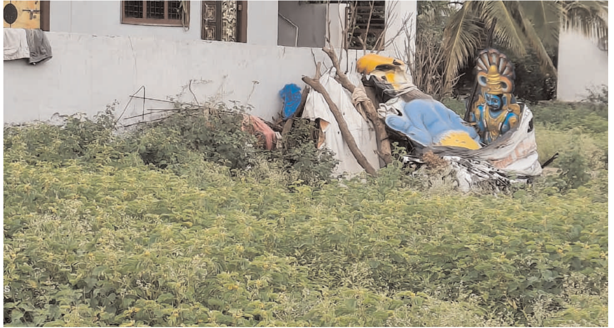
కార్యాలయానికి వస్తూ వెళ్తుంటారు. కానీ దానికి సమీపంలోనే స్వామి వారి విగ్రహాలు బయటపడేయడం గమనించినా ఎన్నోసార్లు వారికి తెలిపినా కూడా పట్టించుకోవడం లేదని వారు ఆగ్రహం వ్యక్తం చేస్తున్నారు. ఇప్పటికైనా మల్లన్నకు ఎంతో చరిత్ర కలిగిన స్వామి వారి విగ్రహాలను బయట