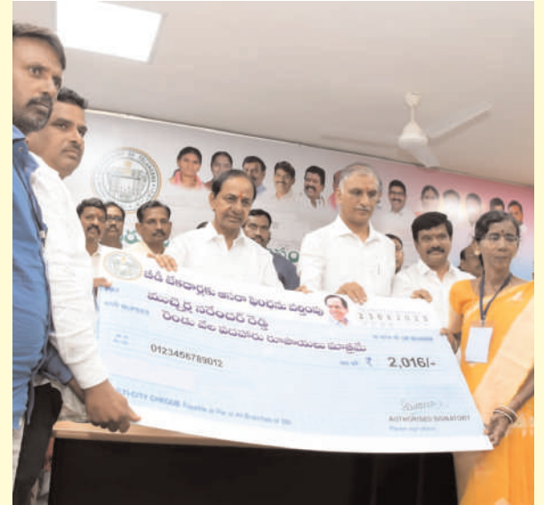
అభించింది. బహిరంగ సభ వేదికపై నుండి మంత్రి హరీష్ రావు ప్రసంగం ప్రారంభం కాగానే కార్యకర్తలు విజిల్స్ తో నూతన ఉత్సాహాన్ని కనబరిచారు. ఏది ఏమైనా ఆధ్వర్యం కేసీఆర్ పర్యటన ఉత్సాహంగా, హుషారుగా సాగింది.