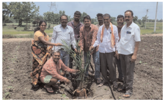
ఆయిల్ ఫామ్ సాగుపై అపోహలు విడనాడాలి