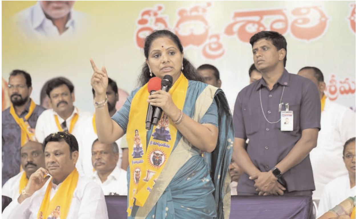
ఇస్తుందని, 24 గంటల నిరంతర విద్యుత్తు ఇస్తుండడం వల్ల బట్టల దుకాణాల్లో డీజిల్ కంపు లేదని వివరించారు. గత ప్రభుత్వాలు చేనేత పరిశ్రమను కుదేలు చేశాయని విమర్శించారు. బీడీ కార్మికులకే కాకుండా టేకేదారులకు కూడా పెన్షన్ అందిస్తున్న ఘనత తెలంగాణ ప్రభుత్వానికే

ప్రజలకు ప్రభుత్వానికి వారధిగా ఉండి పథకాలు అందేలా కుల సంఘాలు కృషి చేయాలని పిలుపునిచ్చారు. సంఘాల పనితీరుపై కూడా పునరాలోచన చేసుకోవాలని సూచించారు. తెలంగాణ రాకముందు పద్యశాలిల కులవృత్తి ప్రమాదంతో ఉండేదని, ఆ సామాజికవర్గానికి చెందిన వారికి ఎక్కువ భూములు కూడా లేవని చెప్పారు. దాంతో బాగా చదువుకొని చాలా మంది డాక్టర్లుగా, శాస్త్రవేత్తలుగా ఆయా వృత్తుల్లో స్థిరపడ్డారని, కానీ గ్రామీణ ప్రాంతాల్లో ఉన్న అనేక మంది పద్యశాలిలు పేదరికంలో ఉండడం దురదృష్టకరమని వ్యాఖ్యానించారు. పద్యశాలిలు వ్యాపారంలో కూడా ఉన్నారని, వ్యాపారానికి శాంతి భద్రతలు ఎంత ముఖ్యమో అందరికీ తెలుసునని అన్నారు. శాంతి భద్రతలను పుష్కలంగా ఇస్తున్న ప్రభుత్వం బీఆర్ఎస్ అని వస్తున్నట్లు చెప్పారు. 60 ఏళ్లలో ఏదో ఒక కొట్లాట ఏదో లొల్లి ఉండేదని, కానీ గత పదేళ్ల కాలంలో ఎటువంటి బిన్ను గొడవ కూడా లేకుండా శాంతి భద్రతలను సమర్థవంతంగా బీఆర్ఎస్ ప్రభుత్వం నిర్వహిస్తోందని తెలిపారు. బట్టల వ్యాపారస్తులకు అనేక ప్రోత్సాహకాలు కెసిఆర్ ప్రభుత్వం