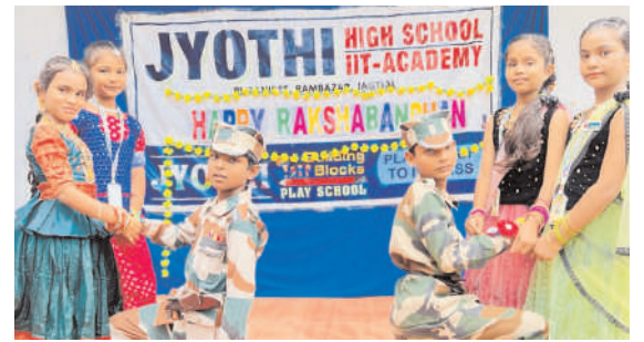
ఘనంగా రక్ష బంధన్ వేడుకలు