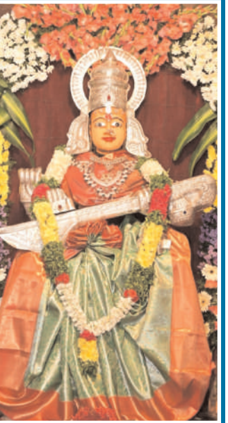
శ్రావణ మాసం రెండో శుక్రవారం శ్రీ వరలక్ష్మి ప్రతం సందర్భంగా కరీంనగర్ లోని శ్రీ మహాశక్తి దేవాలయంలో ప్రత్యేక ఆలంకరణలో కొలువై ఉన్న శ్రీ మహాదుర్గ, శ్రీ మహా సరస్వతి, శ్రీ మహాలక్ష్మి అమ్మవార్లు...