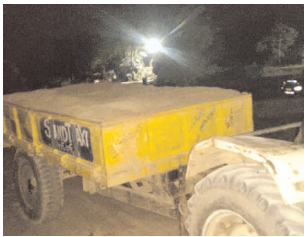
ఆ ప్రజా ప్రతినిధిపై కన్వేసిన అతని వ్యవహార శైలి గమనించి చర్యలు తీసుకోవాలని మండల ప్రజలు కోరుతున్నారు. లేకుంటే అధికార పార్టీకి తీవ్ర నష్టం వాటిల్లే అవకాశం కనబడుతుంది.

మొదటి పేజీ తరువాయి... రాత్రి వేళల్లో అకమంగా ఇతర ప్రాంతాలకు ట్రాక్టర్లతో తరలిపోతుంది. ఈ ట్రాక్టర్లపై కన్వేసిన మండల కేంద్రంలోని ప్రజాప్రతినిధి ఒక్కొక్క ట్రాక్టర్కు నెలకు రూ.5000 నుంచి 7000 వరకు బెదిరించి వసూలు చేస్తున్నాడని మండల కేంద్రంలో గుసగుసలు వినిపిస్తున్నాయి. అతనికి డబ్బులు ఇవ్వకుంటే రెవెన్యూ అధికారులతో లేదా మైనింగ్ అధికారులతో ఆ ట్రాక్టర్లను పట్టింది పైన్ వేస్తున్నట్లు తెలిసింది. దీంతో చేసేదేమీ లేక ఈ గ్రామాలలోని ట్రాక్టర్ల ఓనర్లు నెల నెల ఒక్కొక్క ట్రాక్టర్కు 7000 వసూలు చేసి ఆ ప్రజాప్రతినిధికి ఇస్తున్నట్లు తెలుస్తుంది.దీంతో వారి దండా గత సంవత్సరం నుంచి మూడు పూవులు ఆరు కాయలుగా నడుస్తుందట పోలీసులను నేనే చూసుకుంటా రెవెన్యూ మైనింగ్ అధికారులను నేనే చూసుకుంటా..అంటూ ఆ ప్రజాప్రతినిధి ట్రాక్టర్ ఓనర్లకు చెప్పుతుండడంతో అతనే మధ్యవర్తిగా వ్యవహరిస్తూ ఆ డబ్బులు వసూలు చేస్తున్నాడని ట్రాక్టర్ ఓనర్లే తెలుపుతున్నారు. అలాగే రెవెన్యూ కార్యాలయానికి రైతులు వెళ్లిన తహసీల్దార్ తో పని కావాలన్నా ఆ ప్రజాప్రతినిధి కలిస్తేనే పని అవుతుందని లేకుంటే ఆ పని అవటం లేదని రైతులు కూడా ఆవేదన వ్యక్తం చేస్తున్నారు. పోలీస్ స్టేషన్ కు పోయినా కూడా ఆ ప్రజాప్రతినిధి చెప్పేనే పని అవుతుందని లేకుంటే పనికావడం లేదని ప్రజలు ఆవేదనతో మీడియాకు తెలుపుతున్నారు. ఇప్పటికైనా అధికార పార్టీ అధిష్టానం