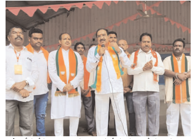
పైసా తీసుకోకుండా చాలామంది నిరుద్యోగులకు ఉద్యోగ అవకాశాలు

గోదావరి, ఆగస్టు 10 (మనం న్యూస్): మాజీ ఎమ్మెల్యే, ఆర్డీసీ చైర్మన్, భారతీయ జనతా పార్టీ రాష్ట్ర నాయకులు సోమారపు సత్యనారాయణ గురువారం సింగరేణి బాయి బాట కార్యక్రమం నిర్వహించారు. గురువారం ఆర్డీ వన్ ఏరియా, వన్ ఇంక్లైన్ మైన్, ఆర్డీ వన్ ఏరియా వర్క్ షాప్ లో కార్మికులను కలిసి మాట్లాడారు. బిజెపి సింగరేణి కార్మికులకు ఎప్పుడు వ్యతిరేకం కాదని, సరేంద్ర మోడీ కార్మికుల సంక్షేమం కోసం అనేక పథకాలు తీసుకువచ్చి, దేశాన్ని ముందుకు తీసుకెళ్తున్నారని తెలిపారు. రామగుండం నియోజకవర్గంలో అభివృద్ధి అంటే ఏమిటో చేసి చూపించానన్నారు. రోడ్లు, డ్రైనేజీలు, గోదావరి నదిలో 20 బోర్లు వేసి 24 గంటలు రామగుండం నియోజకవర్గ ప్రజలకు, సింగరేణి కార్మికులకు దాహాన్ని తీర్చానని తెలిపారు. గోదావరి నదిలో డ్రైనేజీ మురుగునీరు కలిసి రోగాల బారిన పడకుండా, మురుగునీటి శుద్ధి కేంద్రం కట్టించి డ్రైనేజీ వాటర్ ఫిల్టర్ చేసి గోదావరి నది కలుషితం కాకుండా ఉండేలా ప్రాజెక్టు సిద్ధం చేసి నిధులు మంజూరు చేయించినట్లు తెలిపారు. ప్రజల సౌకర్యార్థం కూరగాయల మార్కెట్, మున్సిపల్ కార్పొరేషన్ బిల్డింగ్ కట్టించానని, పారిశుద్ధ కార్మికులకు నయ