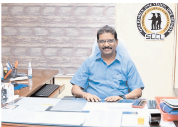
ఎంపికైన అభ్యర్థులు ప్రవేశ రుసుము బ్యాంకు ద్వారా చెల్లించి సీట్స్ ను కేటాయించుకోగలరని తెలియజేశారు.