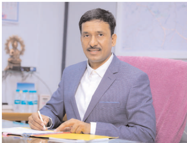
పొందిస్తున్నారని తెలిపారు. వీటిలో క్విజ్, వ్యాసరచన కార్యక్రమాలు, విద్యార్థులకు పర్యావరణ పర్యటనలు, పర్యావరణ సంబంధించిన ముఖ్య దినాలను విద్యాసంస్థల్లో ఉత్సవాలుగా నిర్వహించడం, విద్యాసంస్థలు ప్లాస్టిక్ సంపూర్ణ నిషేధం వంటి కార్యక్రమాలు చేపడుతున్నట్లు వివరించారు. సింగరేణి కాలరీస్ ఎడ్యుకేషనల్ సొసైటీ వ్యాప్తంగా ఉన్న అన్ని పాఠశాలలు కళాశాలలకు సూచనలు జారీ చేశారు.

మంచిర్యాల, ఆగస్టు 6 (మనం న్యూస్): సింగరేణి విద్యా సంస్థ ఆధ్వర్యంలో ఆరు జిల్లాల్లో నిర్వహిస్తున్న అన్ని కళాశాలలు, పాఠశాలల్లో పర్యావరణ అవగాహన, చైతన్యం పై ప్రత్యేక సిలబస్ ను బోధించనున్నామని సింగరేణి సంస్థ డైరెక్టర్ పర్వనల్, ఫైనాన్స్ ఎన్.బలరామ్ ఆదివారం ఒక ప్రకటనలో తెలిపారు. ఏడాది పొడవున అనేక పర్యావరణ హిత కార్యక్రమాలు నిర్వహించడం కోసం ప్రతి తరగతి నుంచి ఒక చురుకైన విద్యార్థిని పర్యావరణ కెప్టెన్ గా ఎంపిక చేస్తున్నామని, పాఠశాల లేదా కళాశాల వ్యాయామ ఉపాధ్యాయుల ఆధ్వర్యంలో కమిటీలను ఏర్పాటు చేస్తున్నామని తెలిపారు. నేటి బాలల రేపటి పాఠాలు కనుక చిన్నతనం నుంచే పర్యావరణపైన అభిమానం, చైతన్యం కలిగించడం కోసం ఈ బృహత్ కార్యక్రమం చేపట్టిస్తున్నామని పేర్కొన్నారు. దేశంలో ఇలా పర్యావరణ కెప్టెన్లను విద్యా సంస్థల్లో నియమించడం అత్యంత అరుదని సింగరేణి కాలరీస్ పర్యావరణహిత చర్యల్లో భాగంగా పిల్లల్లో పర్యావరణ స్పృహను కల్పించడం.. తద్వారా వారి తల్లిదండ్రుల ఆలోచన దృక్పథంలో మార్పును తీసుకొచ్చేందుకు కృషి చేస్తున్నట్లు వివరించారు. సింగరేణి విద్యాసంస్థల ఆధ్వర్యంలో పర్యావరణం పై స్ఫూర్తిదాయకంగా వివరించేందుకు పర్యావరణ సంస్థలైన డబ్ల్యు డబ్ల్యు ఎఫ్, బర్డ్ వాచర్స్, తెలంగాణ రాష్ట్ర అటవీ శాఖల నుండి సమాచారాన్ని బోధనాసాధనలు సేకరించి సిలబస్ను రూపొందిస్తున్నారని తెలిపారు. వీటిలో క్విజ్, వ్యాసరచన కార్యక్రమాలు, విద్యార్థులకు పర్యావరణ పర్యటనలు, పర్యావరణ సంబంధించిన ముఖ్య దినాలను విద్యాసంస్థల్లో ఉత్సవాలుగా నిర్వహించడం, విద్యాసంస్థలు ప్లాస్టిక్ సంపూర్ణ నిషేధం వంటి కార్యక్రమాలు చేపడుతున్నట్లు వివరించారు. సింగరేణి కాలరీస్ ఎడ్యుకేషనల్ సొసైటీ వ్యాప్తంగా ఉన్న అన్ని పాఠశాలలు కళాశాలలకు సూచనలు జారీ చేశారు.