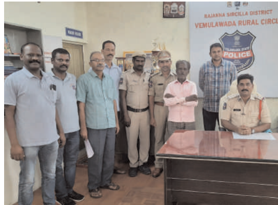
వరంగల్ జైలుకు తరలించినట్లు ఎస్సీ వెల్లడించారు. నిందితుడిని పట్టుకోవడంలో కృషి చేసిన వేములవాడ రూరల్ సిఐ, సిబ్బందికి ఎస్సీ అభినందనలు తెలిపారు.