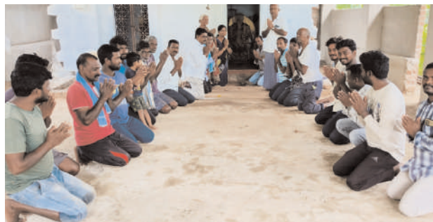
యధావిధిగా ఉంచాలని కోరారు.

చిగురుమామిడి, ఆగస్టు 2 (మనం న్యూస్): తమ గ్రామాన్ని యధావిధిగా కరీంనగర్ జిల్లాలోనే కొనసాగించాలని కోరుతూ చిగురుమామిడి మండలం ఉల్లంపల్లి గ్రామస్తులు బుధవారం ఆంజనేయస్వామి దేవాలయంలో మోకాళ్లపై నిలుచుని పూజలు నిర్వహించారు. అనంతరం యాలాల మల్లికార్జున స్వామికి జలాభిషేకం చేశారు. అనంతరం గ్రామస్తులు మాట్లాడుతూ తమ గ్రామాన్ని కరీంనగర్ జిల్లాలోనే కొనసాగించేలా ఎమ్మెల్యే సతీష్ కుమార్ చొరవ తీసుకోవాలని విజ్ఞప్తి చేశారు. కొంతమంది తెలిపిన తప్పుడు సమాచారాన్ని విశ్వసించకుండా, గ్రామ ప్రజల అభిప్రాయం మేరకు ఉల్లంపల్లిని చిగురుమామిడి మండలంలోనే కొనసాగించాలని కోరారు. గ్రామస్తులంతా తీర్మాణించినట్లుగా తప్పుదోవ పట్టిస్తున్నారని, అవి వారి సొంత అభిప్రాయాలు మాత్రమేనన్నారు. గ్రామస్తులందరి అభిప్రాయం మేరకు ఉల్లంపల్లిని