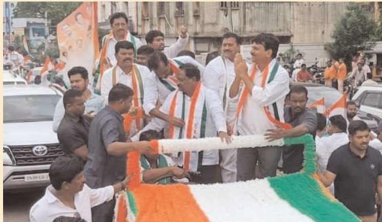
భద్రాద్రి కొత్తగూడెం, ఆగస్టు 1

(మనం ప్రతినది) : రాష్ట్రంలో వరద బాధితుల్ని గాలికి వదిలి తెలంగాణ సిఎం కెసీఆర్ మహారాష్ట్రను ఉద్ధరించడానికి వెళ్ళడాన్ని ఏమనాలని మాజీ ఎంపి, కాంగ్రెస్ పార్టీ ప్రచార కమిటీ కో చైర్మన్, కాంగ్రెస్ పార్టీ రాష్ట్ర ఎన్నికల కమిటీ కో చైర్మన్ పొంగులేటి శ్రీనివాసరెడ్డి సిఎం కెసీఆర్ ను ఘాటుగా విమర్శించారు. మంగళవారం కొత్తగూడెంలో వివిధ పార్టీల