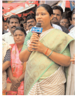
మందికి లైసెన్స్ ఇప్పిస్తామని హామీ ఇచ్చారు. ఈ కార్యక్రమంలో ఇల్లందు పట్టణ ప్రజాప్రతినిధులు ఆటో టి డి ఏ యూనియన్ సభ్యులు వివిధ శాఖల అధికారులు మున్సిపల్ కౌన్సిలర్లు నాయకులు కార్యకర్తలు యువజన నాయకులు తదితరులు పాల్గొన్నారు...