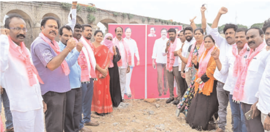
కేసీఆర్, మంత్రి పువ్వాడ చిత్రపటానికి పాలాభిషేకం చేస్తున్న ఖమ్మం నగర బిఆర్ఎస్ నాయకులు(వార్త 2లో)