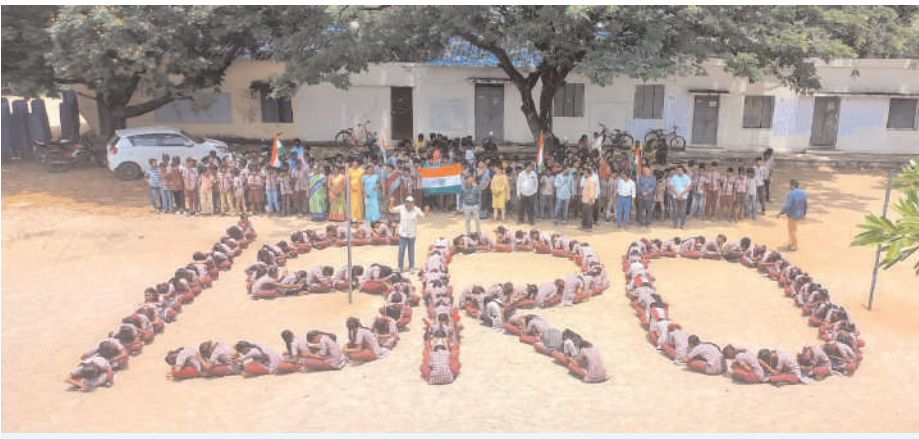
ఖమ్మంలోని శాంతినగర్ హైస్కూల్లో ఇస్లామిక్ వినూత్నంగా అభినందనలు తెలిపిన విద్యార్థులు