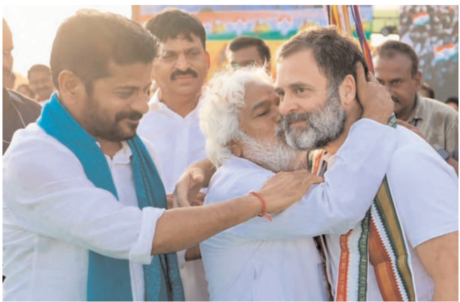
ఇటీవల ఖమ్మంలో జరిగిన కాంగ్రెస్ జన గర్జన సభలో ఏఐసిసి అగ్రనేత రాహుల్ గాంధీని ముద్దాడుతున్న ప్రజా యుద్ధ నాక గద్దర్ (ఫైల్ ఫోటో)

కల్పించినట్లు తెలిపారు. బిఆర్ఎస్ పార్టీ ఇన్స్పిరేషన్ ద్వారా 30 మందికి 60 లక్షలు మంజూరు చేయించినట్లు తెలిపారు. సిఎంఆర్ఎస్ కింద ఎంఎల్సీ బాల సాని లక్ష్మీనారాయణ, మంత్రి పువ్వాడ అజయ్ కుమార్ సహకారంతో 1752 మంది లబ్ధిదారులకు 432.27 లక్షలు మంజూరుచేయించినట్లు తెలిపారు. చింతకాని మండలంలో దళితబంధు పథకం కింద 3462 యూనిట్లకు గాను 3373 యూనిట్లు గ్రాండ్ డింక్ చేయించినట్లు తెలిపారు. బిసి బంధు కింద మండలానికి 50 మంది చొప్పున 300 మందికి లక్ష రూపాయల చొప్పున విడుదల చేయించినట్లు తెలిపారు. ముదిర కమ్యూనిటీ హెల్త్ సెంటర్ ను వంద పడకల ఆసుపత్రిగా అప్ గ్రేడ్ చేయించినట్లు తెలిపారు. 35 కోట్ల అంచనాతో పనులు జరుగుతున్నట్లు తెలిపారు. మాతా శిశు సంరక్షణ కేంద్రానికి ప్రతిపాదనలు పంపినట్లు తెలిపారు. టీఎంఎఫ్ డిసి గ్రాంట్ తో అంబారు పేట ట్యాంక్ బండ్ 3.5 కోట్లతో పూర్తి చేయించినట్లు తెలిపారు. వెజ్, నాన్ వెజ్ మార్కెట్ ను 4.50 కోట్లతో పూర్తి చేసినట్లు తెలిపారు. కోటి రూపాయలతో వైకుంఠదామం నిర్మాణం జరిగినట్లు తెలిపారు. ఎన్డిఎఫ్ కింద 21 పనులు పురోగతిలో ఉన్నట్లు తెలిపారు. జిల్లా మినరల్ ఫండ్ ట్రస్ట్ ద్వారా ముదిర నియోజకవర్గంలో 13 బిటి రెస్యూవల్వ్ అభివృద్ధి పనులు పూర్తి చేయించినట్లు తెలిపారు. సిబిఎఫ్ గ్రాంట్ ద్వారా ముదిర నియోజకవర్గంలో మూడు పనులు పూర్తి చేసినట్లు తెలిపారు. ఎంఆర్ఆర్ గ్రాంట్ ద్వారా ముదిర నియోజకవర్గంలో 588 లక్షలతో ఆరు పనులు పూర్తి చేసినట్లు తెలిపారు.