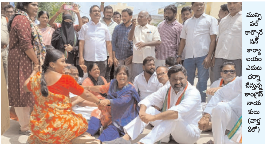
మున్సిపల్ కార్పొరేషన్ కార్యాలయం ఎదుట ధర్మా చేస్తున్న కాంగ్రెస్ నాయకులు (వార్డు 2లో)