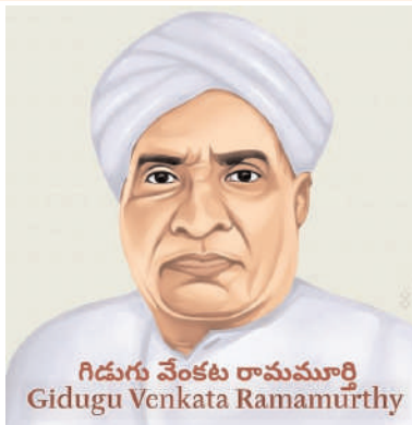
గిడుగు వెంకట రామమూర్తి Gidugu Venkata Ramamurthy

మనకు విలువలు లేకపోయినా..భాషకు విలువలు లేకపోయినా జాతికి దుర్గతి తప్పదు. వ్యవహారిక భాషా ఉద్యమంలో గిడుగు రామమూర్తి పంతులుగారు నిర్వహించిన పాత్ర అద్వితీయం. రామమూర్తి పంతులుగారు తెలుగు లిఖిత భాషలో వచన భాషకు (గ్రాంథిక భాషకు ) ఆనాటి ఛాందస పండితుల విధించిన కఠోర నియమ నిబంధన నుండి విముక్తిని సాధించడమే ధ్యేయంగా పెట్టుకొని తన సర్వసక్తులు వినియోగించారు, తన జీవితకాలం కష్టపడ్డారు. గిడుగు రామమూర్తి పంతులుగారు భాషా విషయంలోనే కాదు అనేక విషయాలలో ఆసమాన పండితులు. ముఖ్యంగా వ్యవహారిక భాష ఉద్యమంలో పంతులుగారు ఆ భాష పట్ల దాని చరిత్ర పట్ల చేసిన పరిశోధన, చారిత్రక వివరాలు సేకరించిన సంచయాల అన్ని ఇన్ని కావు. పంతులుగారు నడుస్తున్నా కూర్చున్నా..మిత్రులు కలిసినా తెలుగు భాష గురిచే మాట్లాడే వారు, భాషీ సమయాల్లో ఆలోచిస్తూ ఉండేవారు. సందర్భం ఏదైనా ఆయన మాటల్లో తెలుగు భాష ప్రస్తావన తప్పక రావాల్సిందే.