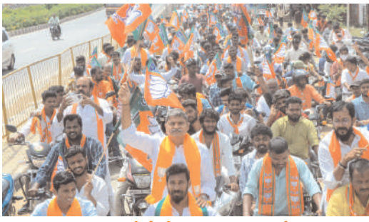
సంగారెడ్డిలో బీజేపి జెండా ఎగురవేస్తూ