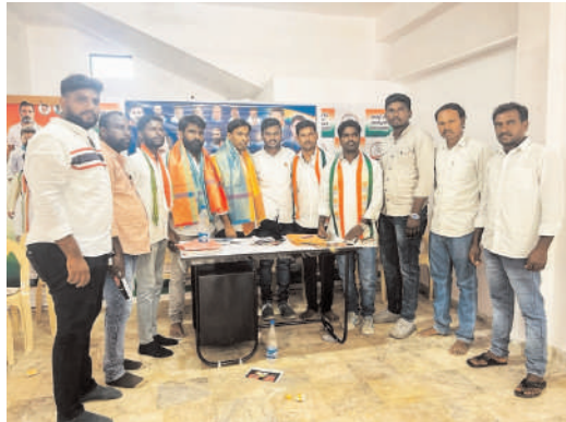
- అధికారంలోకి వచ్చాక అమలు చేసే పథకాలను ప్రజలకు వివరించాలి