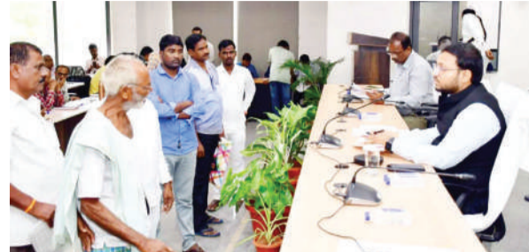
ఎస్సీ రైతులు ఈ పథకాన్ని సర్వీయింగ్ చేసుకునేలా అధికారులు అవగాహన కల్పించేందుకు తమ వంతు కృషి చేయాలని అధికారులు ఆదేశించారు.