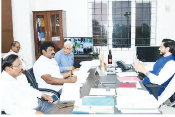
జిలాని సమావేశం మాట్లాడుతూ జిల్లాలో ఉపాధి అవకాశాలు సృష్టించే సేవా రంగ పరిశ్రమలకు ప్రోత్సాహం అందించాలని పరిశ్రమల అధికారులను ఆదేశించారు. ఇందుకు సంబంధించి జిల్లాలో 40 సేవారంగ యూనిట్లకు పరిశ్రమలకు 4.80 కోట్ల రూపాయలు సబ్సిడీ మంజూరు చేస్తున్నట్లు కలెక్టర్ తెలిపారు. పెండింగులో వున్న మూడు

యూనిట్లకు సంబంధించి సంబంధిత అధికారుల నుండి నివేదికలు తెప్పించుకోవాలని కలెక్టర్ సూచించారు. తిరుగుబాటు గురించి 31 యూనిట్లకు సంబంధించి సంబంధితలను కార్యాలయానికి పిలిపించి బ్యాంకింగ్ ప్రాసెస్ పై అవగాహన కల్పించేలా చర్యలు తీసుకోవాలని పరిశ్రమల జిల్లా మేనేజర్ ను కలెక్టర్ ఆదేశించారు. వివిధ బ్యాంకుల్లో పెండింగ్ లో ఉన్న ఖర్చు దరఖాస్తుల మంజూరుకు సంబంధించి తగ్గితగతిన చర్యలు తీసుకోవాలని ఎల్పిఎం రవీంద్రను కలెక్టర్ ఆదేశించారు. బనగానపల్లి మండలం పెట్టుకోట సమీపంలో ఉన్న అలాటిక్ సిమెంట్ ఫ్యాక్టరీ వరకు అప్రోచ్ రోడ్ నిర్మాణానికి తగు భూములను గుర్తించాలని కలెక్టర్ ఆదేశించారు. ఎస్సీ ఎస్టీ బాంబర్ ఆఫ్ కామర్స్ అండ్ ఇండస్ట్రీ రాష్ట్ర అధ్యక్షులు రాజమహేంద్రవరం మాట్లాడుతూ పియూఎజిపి స్టాండ్ అఫ్ ఇండియా, వైఎస్ఆర్ జగన్ అన్న బదుగు విశాం, పథకాల అమలులో బ్యాంకులో విరివిగా రుణాలు ఇవ్వాలని కోరారు. ఔత్సాహిక పారిశ్రామికవేత్తలను ప్రోత్సహించే క్రమంలో ఇండస్ట్రీయల్ డివలప్మెంట్ మరియు బ్యాంకుల సమన్వయంతో అనేక నూతన పరిశ్రమలను స్థాపించడానికి కమిటీయాలని కోరారు.ఎస్సీ ఎస్టీ యొక్క ఆర్థిక అభివృద్ధిలో భాగంగా మరింత ప్రోత్సాహాన్ని అందించాలని కలెక్టర్ ను కోరారు.