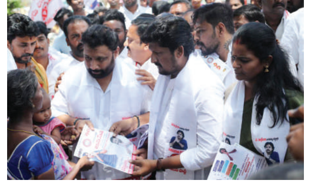
నిదర్శనంగా మన పవన్ కళ్యాణ్ ను ముఖ్యమంత్రి చేసుకోవడం ద్వారా, రాష్ట్రం సుఖిక్షణగా ఉంటుందని ముఖ్యంగా లా ఆండ్ ఆర్డర్ ను చక్కదిద్ది ఆడపడుచులకు ఆంధ్రా నిలవడమే జనసేన యొక్క ముఖ్య లక్ష్యం అని, పక్క రాష్ట్రాలకు తరలిపోయే వారికి ఉపాధిని కల్పిస్తామని హామీ ఇచ్చారు.