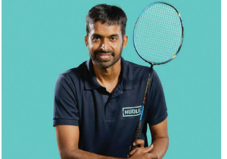
ఎన్నో రికార్డులు.. అవార్డులు

భారత బ్యాడ్మింటన్ పులి గోపిచంద్ ఒక దిగ్గజం. తన అద్భుతమైన ఆటతో ఈతరం ఆటగాళ్లకు సూర్యునిగా నిలిచాడు. ప్రస్తుతం జాతీయ జట్టుకు హెడ్ కోచ్ గా ఉన్న అతను తన జీవితంలోని అసక్తికర విషయాలను పంచుకున్నాడు. బెంగళూరులోని మనకం ట్రోల్ స్పార్ట్స్ కాంప్లెక్స్ 2023 కార్యక్రమంలో మాట్లాడిన గోపిచంద్ మొదట్లో క్రికెటర్ అవ్వాలనుకున్నాని చెప్పాడు. కానీ, జట్టులో చోటు దక్కకపోవడంతో బ్యాడ్మింటన్ వైపు వచ్చాడు. చిన్నప్పుడు ఫుట్ బాల్ నా ఫేవరైట్ గేమ్. కానీ, నా మోకాళ్లు సహకరించకపోవడంతో ఫుట్ బాల్ ఆడలేకపోయాను. అయితే.. క్రికెటర్ అవ్వాలనుకున్నా కానీ, జట్టులోకి నన్ను తీసుకోలేదు. దాంతో, బ్యాడ్మింటన్ ఆటపై దృష్టి సారించాను' అని ద్రోణాచార్య అవార్డు గ్రహీత అయిన గోపిచంద్ తెలిపాడు.