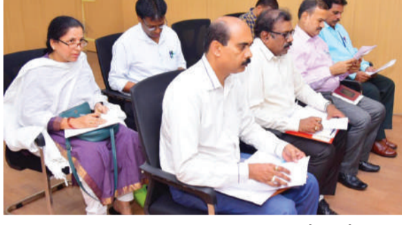
లింగ నిష్పత్తి 970 / 1000 ఉందని, ఇతర జిల్లాలతో పోలిస్తే మన జిల్లా తక్కువగా లింగ నిష్పత్తి కలిగి ఉందని, పిసిపిఎన్టీటీ యాక్టును పక్కాచేస్తే అమలు చేయాలని జిల్లా కలెక్టర్ లింగ నిష్పత్తిని పెంచేందుకు అవసరమైన చర్యలు చేపట్టాలన్నారు. జిల్లాలో స్కానింగ్ సెంటర్ల నిర్వహణలు ఎవరైనా లింగ నిర్ధారణ పరీక్షలు చేస్తే అలాంటి వారిపై కఠిన చర్యలు తీసుకోవాలన్నారు. ఇందుకోసం క్షేత్రస్థాయి లో ఆకస్మిక తనిఖీలు చేపట్టాలని డిఎంహెచ్ టోని ఆదేశించారు. ప్రతి స్కానింగ్ సెంటర్ కి ప్రభుత్వ అనుమతి తప్ప నిరసంగా ఉండాలని, అనుమతులు లేని వాటిపై కఠిన చర్యలు తీసుకోవాలన్నారు. హిందూపురం లో రాత్రిపూట కూడా ఒక స్కానింగ్ కేంద్రం లో స్కానింగ్ చేస్తున్నట్లు ఆంధ్ర రాష్ట్ర అధికారులు తెలియజేయగా, హిందూపురం పై

సత్యసాయి జిల్లా, జూలై 07, మనం ప్రతినిధి : పిసిపిఎన్టీటీ యాక్టును పక్కాచేస్తే అమలు చేయాలని జిల్లా కలెక్టర్ పి.అరుణ్ బాబు సంబంధిత అధికారులను ఆదేశించారు. శుక్రవారం పుట్టపర్తి కలెక్టర్ ట్లోని జిల్లా కలెక్టర్ ఛాంబర్ లో పిసిపిఎన్టీటీ యాక్టుపై అంతర్ రాష్ట్ర సరిహద్దు జిల్లాజైన్ కర్ణాటకలోని చిక్కలపూర్, తుమకూరు, శ్రీ సత్యసాయి జిల్లా వైద్య ఆరోగ్య శాఖ అధికారులతో సమావేశం నిర్వహించారు. ఈ సందర్భంగా జిల్లా కలెక్టర్ మాట్లాడుతూ జిల్లాలో