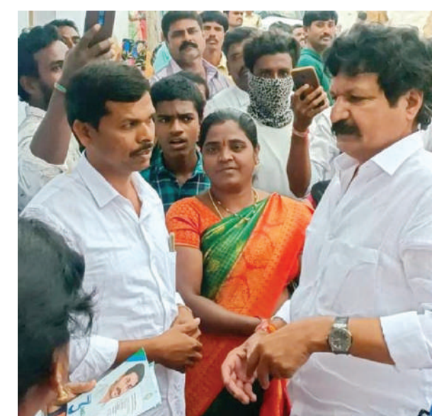
పక్క ఇంట్లో మంజూరు చేయడం జరిగింది న్నారు. గ్రామం సంపూర్ణ అభివృద్ధి దిశలో పయనిస్తోందన్నారు. గతంలో వివిధ పనుల కోసం ప్రజలు అపేసలు చుట్టూ తిరగల్గి వచ్చేవారు. సీఎం జగన్ పాలనలో అధికారులు, ఉద్యోగులు, సచివాలయ సిబ్బంది, సర్పంచులు, వాలంటీర్లు, గృహసాయుధులు కన్వీనర్లు ప్రజల వద్దకి వెళ్లి ఎవరి స్థాయిలో వారు సమస్యలను పరిష్కరిస్తున్నారన్నారు. ప్రభుత్వ పాలన ప్రతి ఇంటి గడప తొక్కుతోందన్నారు. పైసా ఖర్చు లేకుండా జగనన్న సురక్ష కార్యక్రమంలో ప్రజలకు పనులు జరుగుతున్నాయి.