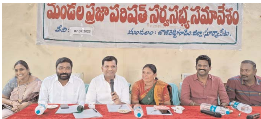
గ్రామాల సర్పంచ్లు, ఎంపీపీపీ ఉలు అధికారులు తదితరులు పాల్గొన్నారు.