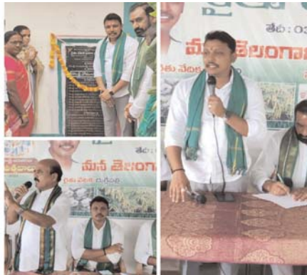
ప్రజలను మళ్ళిపెట్టి అధికారంలోకి రావడం అధికారంలోకి వచ్చాక ప్రజాధనాన్ని దోచుకోవడం, దాచుకోవడమే కాంగ్రెస్ పార్టీ నాయకుల నైజం.

లిరైతు బంధు పథకం కింద ఎకరాకు పదివేల పెట్టుబడి సాయం, మరణించిన రైతు కుటుంబానికి 5 లక్షల రూపాయల సహకారం, వ్యవసాయానికి 24 గంటలు ఉచిత విద్యుత్తు అందజేయడంతో పాటు రాష్ట్రంలో నీటి తీరువారద్దు చేసిన ఘనత ముఖ్యమంత్రి కేసీఆర్ దే దేశంలో రైతులు పండించిన ధాన్యాన్ని కొనుగోలు చేయాల్సిన బాధ్యత కేంద్ర ప్రభుత్వంపై ఉంది.కానీ ధాన్యం కొనుగోలు చేయడంలో కేంద్ర ప్రభుత్వం వెన్నుచూపితే రాష్ట్రంలో రైతు పండించిన ప్రతి గింజ ధాన్యాన్ని కొనుగోలు చేసి రైతులను ఆదుకున్న ఘనత బిఆర్ఎస్ ప్రభుత్వానిది.ముఖ్యమంత్రి కేసీఆర్ పాలనలో 24 గంటల ఉచిత విద్యుత్ వలన రాష్ట్రంలో రైతులంతా మూడు పంటలు సాగు చేస్తున్నారని లికాంగ్రెస్ పార్టీ అధికారంలో ఉన్నప్పుడు ఏ రోజు కూడా రైతు సంక్షేమం గురించి ఆలోచించలేదు.