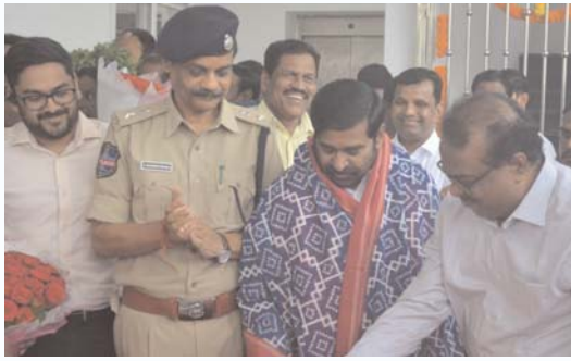
నాయకులు, కార్యకర్తలు, అభిమానులు పాల్గొన్నారు.