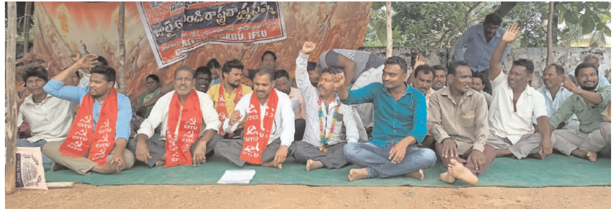
,మా న్యాయమైన డిమాండ్లను పరిష్కరించాలని లేదంటే సమ్మె మరింత ఉద్ధృతం చేస్తామని చెప్తూ నినాదాలు చేయడం జరిగింది. ఈ కార్యక్రమంలో గ్రామ