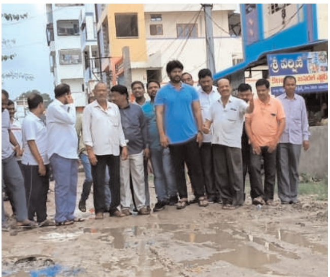
గోదావరిఖని, జూలై 21 (మనం న్యూస్): రామగుండం కార్పొరేషన్ లోని ప్రజల