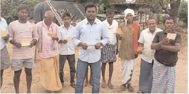
ఇప్పటికైనా రాష్ట్ర ప్రభుత్వం అన్నదాతల కష్టాలను అర్థం చేసుకుని తక్షణమే రెండు లక్షల రూపాయల రుణమాఫీతో పాటు వచ్చే సీజన్లో సాగుచేయడానికి అనుగుణంగా రుణాలు అందించాలని ఆయన కోరారు.