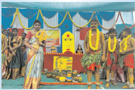
విద్యాలయాల్లో ఘనంగా బోనాల వేడుకలు