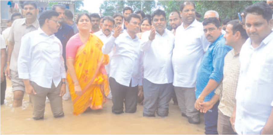
భద్రాచలం : ముంపు ప్రాంతాల్లో ఎంపీ నామ నేతృత్వంలో ఎంపీల బృందం పర్యటన