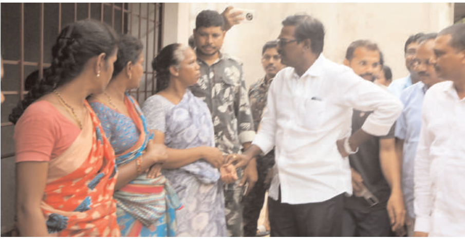
చర్ల వునరావాస కేంద్రంలో బాధితులకు మంత్రి వువ్వాడ భరోసా...