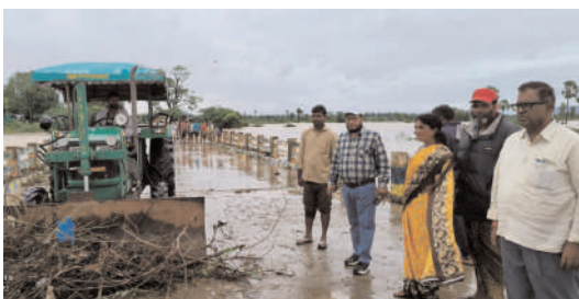
పటిష్ట చర్యలు చేపట్టారు.