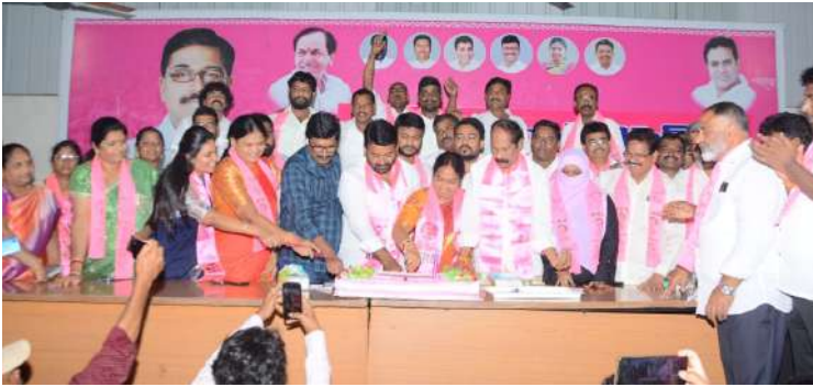
మంత్రి పువ్వాడ క్యాంప్ కార్యాలయంలో కేటీఆర్ పుట్టిన రోజు వేడుకలను నిర్వహిస్తున్న బిఆర్ఎస్ శ్రేణులు ( వార్త 2లో)