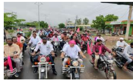
కార్యక్రమంలో పలువురు అధికారులు ప్రజా ప్రతినిధులు, పలువురు టీఆర్ఎస్ శ్రేణులు కార్యకర్తలు తదితరులు పాల్గొన్నారు.