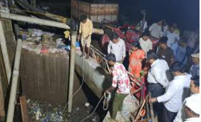
పరిశుభ్రం చేయాలని, ఎలాంటి వ్యర్థాలు లేకుండా పరిశుభ్రంగా ఉంచాలని ఆదేశించారు.