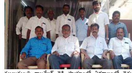
ముఖ్యమంత్రి రాజశేఖర్ రెడ్డి హయాంలో ఏకకాలంలో రైతు రుణమాఫీ చేసిన ఘనత కాంగ్రెస్ పార్టీదేనని గుర్తు చేశారు. రైతులకు రాజు చేసిన ప్రభుత్వం కూడా కాంగ్రెస్ను కీర్తించారు. సాక్షాత్తు తెలంగాణ రాష్ట్ర ముఖ్యమంత్రి కేసీఆర్ బోసకల్ మండల కేంద్రంలో పంట నష్టపరిహారం పరిశీలించేందుకు వచ్చి ప్రతి ఎకరాకు పది వేలు నష్టపరిహారం చెల్లొస్తుమని ప్రకటించి వెళ్ళారని, ఇప్పటివరకు మండలంలో ఎన్ని ఎకరాలకు పంట నష్ట పరిహారం క్రింద పదివేల రూపాయలు చెల్లించారో చెప్పాలని బంధం శ్రీనివాసరావును ప్రశ్నించారు. టీడీపీ లెక్కపోతే బీఆర్ఎస్ పార్టీకి నామూరపాలే లేవన్నారు. అలాంటి బీఆర్ఎస్ పార్టీలో ఉన్న మీరు తెలంగాణ రాష్ట్రం ఇచ్చిన పార్టీ కాంగ్రెస్ ను పార్టీ అధ్యక్షుడు రేవంత్ రెడ్డిని విమర్శించడం దెయ్యాల వేదాలు వల్లించినట్లుగా ఉందని ఎద్దేవా చేశారు. ఈ సమావేశంలో కలకోట సొసైటీ చైర్మన్ కర్నూటి రామకృష్ణారావు, మండల కిసాన్ సెల్ అధ్యక్షులు సత్యమోతు సత్యనారాయణ, చౌపాకట్లపాలెం, చిరునోముల సర్పంచులు ఎర్రంశెట్టి సుబ్బారావు, ములకారపు రవి, యూత్ కాంగ్రెస్ అధ్యక్షుడు భద్ర నాయక్, వంగాల రామారావు, అచ్చయ్య పాల్గొన్నారు.