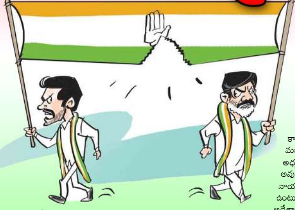
ఇటువంటి గ్రూపు రాజకీయాలు ఉండడం పార్టీకి మరింత నష్టం కలిగే అవకాశాలు లేకపోలేదు.