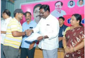
తప్పనిసరిగా కలిగి ఉండాలింది డ్రెవింగ్ లైసెన్స్ అని పేర్కొన్నారు. ముఖ్యంగా యువత ఎక్కువ శాతం వాహనాలు నడుపుతున్నారు.. ప్రమాద రహితంగా వాహనాలు నడపాలని సూచించారు. ఇటీవలే కాలంలో ప్రమాదాలు ఎక్కువగా జరుగుతున్నాయని, 6లో..

ఖమ్మం, జూలై 17(ఉసం స్టూన్) : డ్రెవింగ్ లైసెన్స్ కలిగి ఉండటం ప్రతి పౌరుడి హక్కు అని, 18వేళ్లు నిండిన ప్రతి పౌరుడు విధిగా లైసెన్స్ తీసుకోవాలని రవాణా శాఖ మంత్రి పువ్వాడ అజయ్ కుమార్ అన్నారు. వీడియోస్కాని క్యాంపు కార్యాలయంలో పువ్వాడ ఫౌండేషన్ అధ్యక్షులలో విజయవంతంగా కొనసాగుతున్న ఉచిత లైసెన్సు లో మంత్రి పువ్వాడ పాల్గొని మాట్లాడారు. ఆన్లైన్ చేసుకున్న వారికి సోమవారం లెర్నింగ్ లైసెన్స్(ఎల్ఎల్ఆర్) ద్వారా పత్రాలను సోమవారం మంత్రి స్వయంగా పంపిణీ చేశారు. నేడు 170 మంది ఎల్ఎల్ఆర్ కు దరఖాస్తు చేసుకోగా, 347 మందికి మంత్రి పువ్వాడ ఎల్ఎల్ఆర్ పత్రాలను పంపిణీ చేశారు. కాగా నేటి వరకు మొత్తం 795 మంది ఎల్ఎల్ఆర్ లైసెన్స్ పొందడం జరిగింది. ఈ సందర్భంగా వారు మాట్లాడుతూ.. ప్రతి పౌరుడు