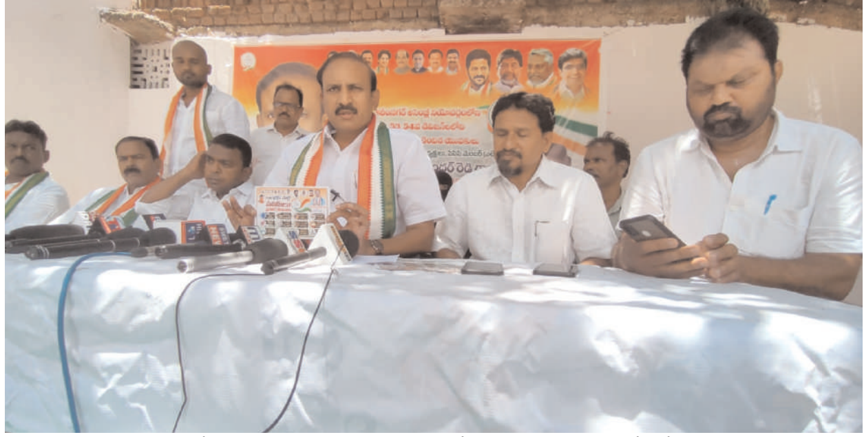
మొదలుకొని ఇచ్చిన ప్రతి హామీ నిలబెట్టుకున్న ఘనత కాంగ్రెస్ పార్టీదేనన్నారు. తెలంగాణలో కూడా నాలుగువేల రూపాయల వృద్ధాప్య పింఛన్ తో పాటు అయిదువందల కే గ్యాస్ సిలిండర్, మహిళలందరికీ ఉచిత బస్సు ప్రయాణం, విద్యార్థులకు ఎలక్ట్రిక్ సూట్ బుట్ట, ఇందిరమ్మ ఇల్లు కట్టకోవడానికి అయిదు లక్షల రూపాయలు, మొదటి సంవత్సరంలోనే రెండు లక్షల ప్రభుత్వ ఉద్యోగాల భర్తీ ఇలా ఇచ్చిన ప్రతి హామీని నెరవేరుతామని