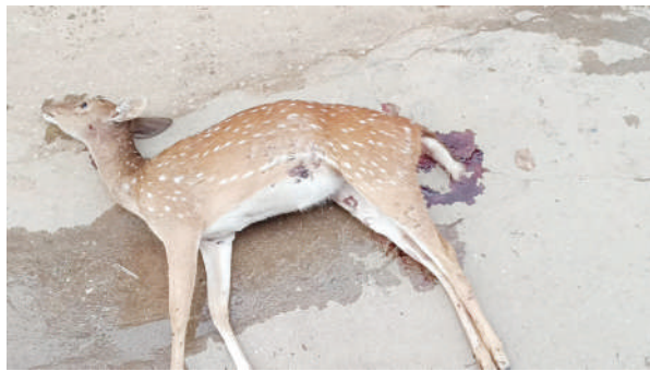
అమ్ముకుంటూన్నారని కొందరి అనుమానం.