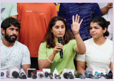
ఆసియా గేమ్స్ ట్రయల్స్..