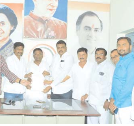
ఎంపీటీసీ తలకొప్పుల సైదులు తదితరులున్నారు.