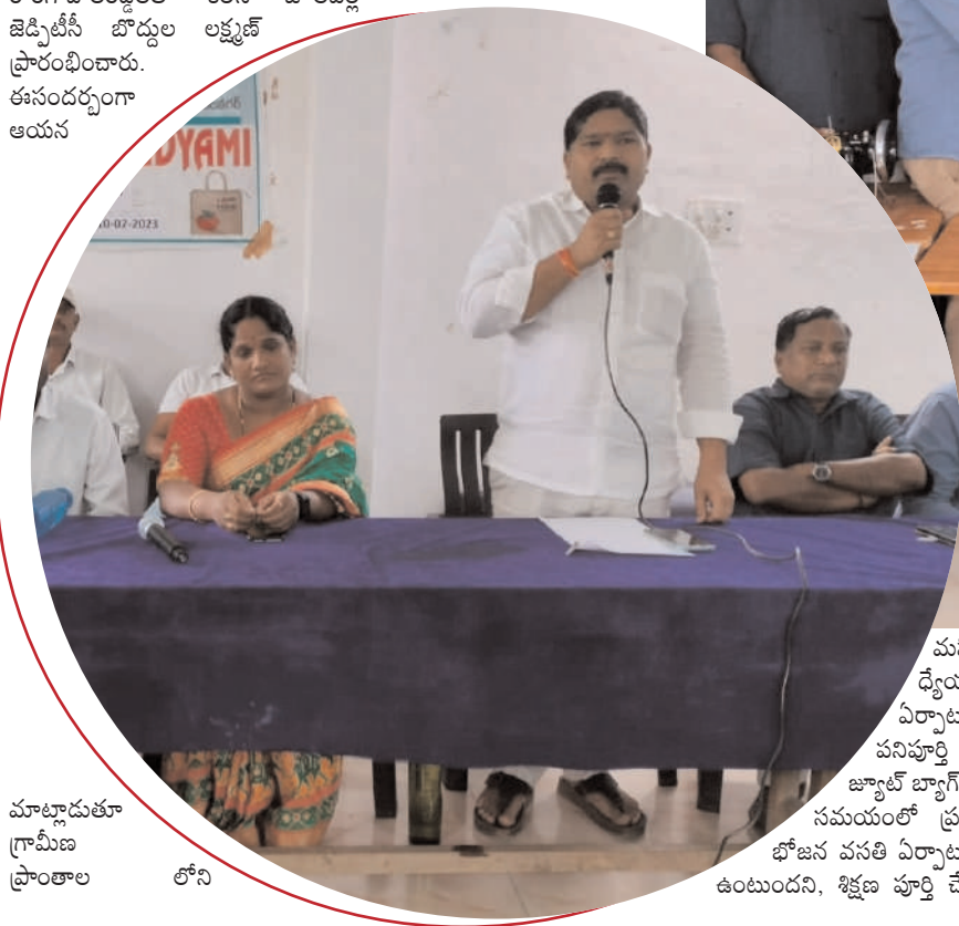
మాట్లాడుతూ గ్రామీణ ప్రాంతాల లోని

మహిళలకు స్వయం ఉపాధి కల్పించడమే ధ్యేయంగా ప్రభుత్వం ద్వారా ఈశిక్షణ కార్యక్రమాన్ని ఏర్పాటు చేశామని అన్నారు. ఈజీఎస్ లో 100 రోజులు పనిపూర్తి చేసిన 95 మంది మహిళలను గుర్తించి వారికి జ్యూట్ బ్యాగ్లు కుట్టడంలో శిక్షణ ఇస్తారని తెలిపారు. ఈశిక్షణ సమయంలో ప్రతి ఒక్కరికీ రూ. 272 రూపాయలు మరియు భోజన వసతి ఏర్పాటు చేశామని అన్నారు. ఈశిక్షణ 13 రోజుల పాటు ఉంటుందని, శిక్షణ పూర్తి చేసుకున్న వారికి సర్టిఫికేట్ ప్రధానం చేస్తామని,