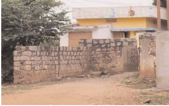
అసౌకర్యం కలగకుండా త్వరితగతిన ఆసుపత్రికి తీసుకు వెళ్ళవచ్చని తద్వారా రోగిని ప్రమాదం నుంచి త్వరగా కాపాడటం జరుగుతుందని క్రాంతి యువజన సేవా సంఘం సభ్యులు తెలుపుతున్నారు