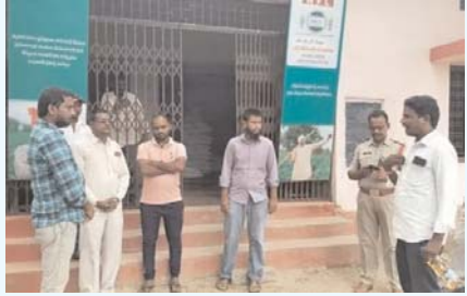
ఇవ్వడంతో ఆందోళన విరమించాడు.

అమ్ముకున్నాడు. ధాన్యం కొనుగోలు చేసినట్లు అధికారులు ఇలాంటి రసీదు ఇవ్వలేదు. ధాన్యం క్వింటాలు 10 కేజీల ధాన్యం కట్ చేశారని అన్నారు. తాను అమ్ముకున్న ధాన్యం కు బిల్లులు ఇవ్వకుండా మొత్తం బిల్లుపై రూ. ఇరవై వేలు కోత విధించారని రైతు ఆందోళన వ్యక్తం చేశారు. 208 బస్తాలకు ట్రాక్ షీట్ ఇచ్చారని మిగతా బస్తాలకు బిల్లులు ఇవ్వలేదని చెప్పారు. మిగతా బస్తాల బిల్లులు అడిగితే అధికారులు నిర్లక్ష్యంగా సమాధానం చెబుతున్నారని అన్నారు. అధికారులు న్యాయం చేస్తారని హామీ