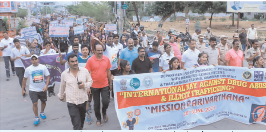
మాదకద్రవ్యాల నిరోధక దినోత్సవం సందర్భంగా ఖమ్మంలో భారీ ర్యాలీ (వార్త 2లో)