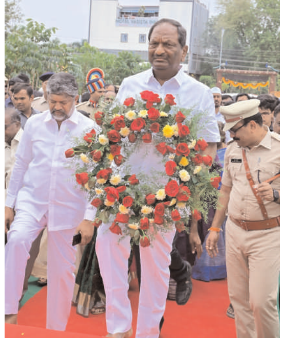
అధికారులు, తదితరులు పాల్గొన్నారు.