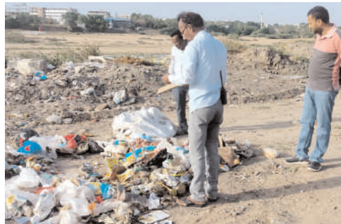
చెత్త వేసిన దుకాణాదారునికి