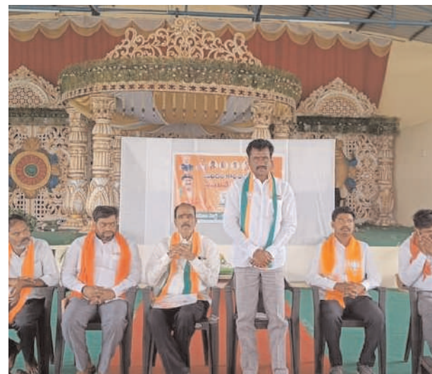
ప్రక్రియ నిర్వహించకుండా పనులపై అలసత్వం ప్రదర్శించిందన్నారు. ఆర్డీబి అంశంలో పూర్తిగా కెసీఆర్ ప్రభుత్వం నిర్లక్ష్య వైఖరిని ప్రదర్శించి, నేడు ఆర్డీబి సమస్య కొలిక్కి వచ్చి టెండర్లకు ఆహ్వానించిన నేపథ్యంలో బిఆర్ఎస్ శ్రేణులు సంబరాలు జరుపుకోవడానికి సిగ్గుండాలన్నారు. బి ఆర్ ఎస్ నేతలకు విజ్ఞత ఉంటే ఆర్డీబి పనులపై తప్పుడు ప్రకటనలు చేయడం మానుకోవాలని, కేంద్ర ప్రభుత్వ నిధులతో పనులు జరుగుతున్నందుకు బిజెపి మోడీ ప్రభుత్వానికి కృతజ్ఞతలు తెలియజేయాలని ఆయన ఈ సందర్భంగా డిమాండ్ చేశారు.

చేసినా, రాష్ట్ర ప్రభుత్వం తన వాటా నిధులను రిటైజ్ చేయలేదన్నారు. రాష్ట్ర ప్రభుత్వ నిర్లక్ష్య కారణంగా ఆర్డీబి అంచనా వ్యయం నేడు 126.74 కోట్లకు పెరిగిందన్నారు. తీగలగుట్టపల్లి ప్రాంతంలో రోడ్ ఓవర్ బ్రిడ్జి లేకపోవడంతో అనునిత్యం ఇక్కడి ప్రాంతం మీదుగా ప్రయాణం చేసే వాహన దారులు, ప్రజలు, ముఖ్యంగా ఆసుపత్రులకు వచ్చే రోగులు తీవ్ర ఇబ్బందులు ఎదుర్కొంటున్నా, ప్రభుత్వం ఇన్నేక్షన్ చోద్యం చూస్తుందన్నారు. ఇక్కడి ప్రాంతంలో జటిలంగా మారిన ఆర్డీబి సమస్యను అధికారంలో ఉన్న కెసీఆర్ ప్రభుత్వం గాలికి వదిలేస్తే, కరీంనగర్ పార్లమెంటు సభ్యుడు బండి సంజయ్ కుమార్ పట్టుదల కృషితో రైల్వే ఓవర్ బ్రిడ్జి నిర్మాణ సమస్యను పరిష్కరించడానికి ప్రత్యేక శ్రద్ధ తీసుకున్నారని తెలిపారు. ఆర్డీబి ప్రాజెక్టు నిర్మాణ విషయంలో బిఆర్ఎస్ ప్రభుత్వం తగిన నిధులు మంజూరు చేయడానికి ముందుకు రాక, ఏడాదికాలంగా జాప్యం చేయడంతో ఎంపీ బండి సంజయ్ కుమార్ ఇట్టి ప్రాజెక్టును పూర్తిస్థాయి కేంద్ర ప్రభుత్వ నిధులతోనే నిర్మాణం చేపించడానికి నూతన ప్రతిపాదనలతో కేంద్ర ప్రభుత్వ సేతు బంధన్ నిధులతో తీగలగుట్టపల్లి ఆర్డీబిని రూపాయలు 126.74 కోట్లతో నిర్మాణం చేపట్టడానికి కేంద్ర ప్రభుత్వం ద్వారా గ్రీన్ సిగ్నల్ ఇచ్చిందారని పేర్కొన్నారు. ఎంపీ బండి సంజయ్ కుమార్ పై రాజకీయ విమర్శలు చేయడమే పనిగా పెట్టుకున్న బిఆర్ఎస్ ప్రభుత్వానికి, ఆ పార్టీ నాయకులకు 126.74 కోట్లతో కేంద్ర ప్రభుత్వమే రోడ్ ఓవర్ బ్రిడ్జి నిర్మాణం చేసే విధంగా బండి సంజయ్ కుమార్ ప్రయత్నం చేసి అందులో సక్సెస్ కావడం ఆయన పనితీరుకు నిదర్శనంగా నిలుస్తుందన్నారు. అయితే ఆర్డీబి నిర్మాణ పనులను పూర్తి చేయడానికి కేంద్ర ప్రభుత్వమే ముందుకు వచ్చిన రాష్ట్ర ప్రభుత్వం ఏడు నెలల కాలంగా ఏలాంటి సమీక్ష, టెండర్ల