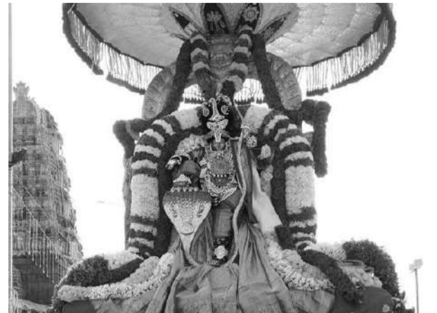
శ్రీ కోదండరామస్వామివారి ఆలయంలో ఆదివారం సాయంత్రం 6 నుండి రాత్రి 9.00 గంటల వరకు పుష్పయాగం వైభవంగా నిర్వహించనున్నారు.