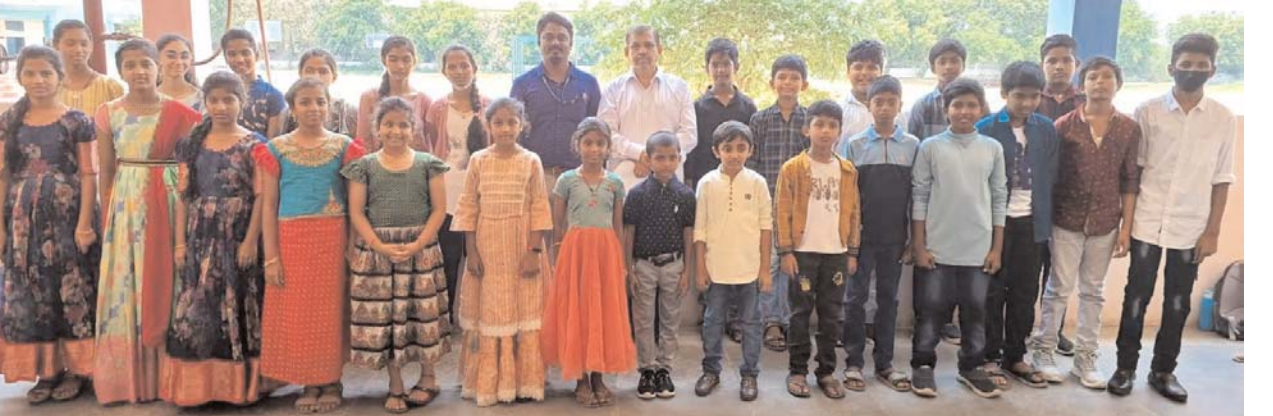
హుజూర్ నగర్, ఏప్రిల్ 22, మనం న్యూస్:

పట్టణంలోని వర్డ్ ఇన్స్టిట్యూట్ ఇంటర్నేషనల్ పాఠశాల విద్యార్థిని విద్యార్థులు ఆల్ ఇండియా టాలెంట్ ఓలంపియాడ్ తుది ఫలితాల్లో ర్యాంకు ప్రభుజనం సృష్టించారు. శనివారం పాఠశాలలో ఉత్తమ