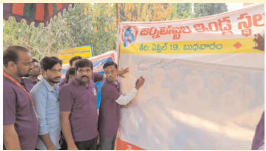
జర్నలిస్టులకు తక్షణమే ఇండ్ల స్థలాలు కేటాయించాలి