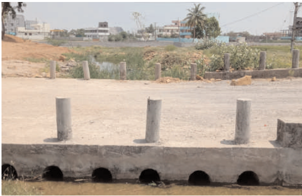
మొదటి పేజీ తరువాయి..

పెరిగి ఆకాశానంటుకున్నాయి. సామాన్యుడు కొనలేని స్థితిలో ధరలు విపరీతంగా పెరిగిపోయాయి. అసాధికార వెంచర్లు వేస్తూ కోట్లాది రూపాయల రియల్ ఎస్టేట్ వ్యాపారం నిర్వహిస్తున్నారు. వెంచర్లకు ఎలాంటి అనుమతులు లేకున్నా రిజిస్ట్రేషన్లు జరుగుతున్నాయని మాముళ్ల మత్తులో నిబంధనలకు విరుద్ధంగా అధికారులు వ్యవహరిస్తున్నట్లు ప్రచారం కొనసాగుతుంది. వందల ఎకరాల పంట పొలాలకు మత్తడి ద్వారా నీరందాల్ని ఉండగా మోడల్ చెరువుకు దిగువనున్న గుండ్ల చెరువుకు లింక్ ద్వారా గొలుసు కాలువలు న్నాయి. కాని ప్రస్తుతం అవి కనిపించకుండా పోయాయి. కొన్నింటిని రియల్ ఎస్టేట్ వ్యాపారులు వాటి దారి మళ్ళించారు. కబ్జా కోరల్లో చిక్కుకున్న గొలుసు కాలువలు వాటి విస్తీర్ణం కోల్పోయి కుదించబడ్డాయి. నాలా కన్వర్షన్ మాట దేవుడెరుగు కాని అక్కడ నిర్మాణాలు జరిగితే భవిష్యత్ లో ముంపుకు గురవడం ఖాయమనే ఆందోళన వ్యక్తమవుతోంది. మోడల్ చెరువు నుండి నీరు విడుదలై ఎడమ కాలువల్లో భాగమైన మొదటి గొలుసు కాలువ ద్వారా