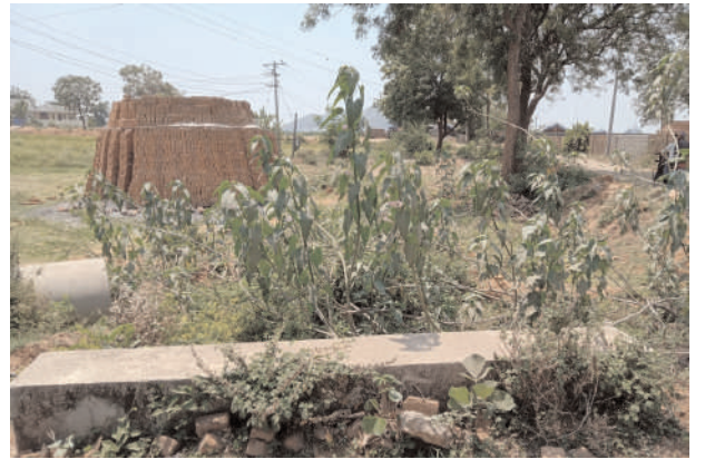
అధికారుల నిర్లక్ష్యం.. ప్రజలకు శాపం..

పట్టణంలోని కాలువలు, ప్రభుత్వ స్థలాలను అక్రమణలకు గురిచేసి లక్షల రూపాయలను దండుకుంటున్న రియల్ వ్యాపారులు మాయమాటలు చెబుతూ క్రయ విక్రయాల అసంతరం మొహం చాటేస్తున్నారు. మిషన్ కాకతీయ లాంటి గొప్ప పథకాలు ప్రభుత్వం చేపడుతున్నప్పటికీ గొలుసు కాలువలపై ప్రభుత్వం దృష్టి పెట్టక పోవడం, గొలుసు కాలువలు కబ్జాకు గురౌతున్న అధికారులు నిమ్మకు నీరేత్తినట్లు వ్యవహరిస్తున్నారన్న ఆరోపణలున్నాయి. నాలా కన్వర్షన్లు లేకుండా రియల్ ఎస్టేట్ వ్యాపారుల లాభాల కోసం వ్యవసాయ భూముల క్రయ విక్రయాలు జరుగుతున్నా అధికారులు చూసి చూడనట్లు వ్యవహరిస్తుండడం పట్ల విమర్శలు వ్యక్తమవుతున్నాయి. పచ్చని పంట పొలాలు ప్లాట్లుగా రూపాంతరం చెందిన అసంతరం కూడా సంబంధిత అధికారులు, సిబ్బంది నిర్లక్ష్యం మూలంగా అలాంటి భూములకు ఇప్పటికీ రైతు బంధు లభిస్తున్నట్లు సమాచారం. ప్లాట్లుగా మారిన వ్యవసాయ భూములను రికార్డుల్లో మార్చే విషయంలో సంబంధిత సిబ్బంది, అధికారుల అలసత్వం కారణంగా లక్షలాది రూపాయల నిధులు పక్కదారి పడుతున్నాయి. ప్రభుత్వ రికార్డుల్లో ఈ స్థలాలు ఇంకా వ్యవసాయ భూములుగానే ఉన్నప్పటికీ, సంబంధిత మున్సిపల్ టౌన్ ప్లానింగ్ విభాగం అధికారులు మాత్రం ఆయా స్థలాల్లో ఇళ్ళ నిర్మాణాల కోసం అనుమతులు జారీ చేస్తుండడం కొనమెరుపు. రియల్ ఎస్టేట్ వ్యాపారుల చేతుల్లో కబ్జాకు గురైన గొలుసు కాలువలను ఇప్పటి కైనా పునరుద్ధరించి సమస్యలను పరిష్కరించాలని సంబంధిత అధికారులను స్థానికులు కోరుతున్నారు.