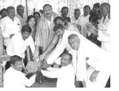
పంటను నిల్వ చేసుకునేందుకు సహకార సంఘం ఆధ్వర్యంలో ప్రభుత్వం కోట్ల రూపాయలను వెంచించి గోధామలను ఏర్పాటుచేస్తున్నట్లు పెర్మిట్టారు. రైతులకు సిఎంకెఆర్ ఎల్లప్పుడు

నడిగూడెం మార్చి 31 మనం న్యూస్: రైతులకు అండగా వ్యవసాయ రంగం అభివృద్ధి చెందాలని డైరీ, పౌల్ట్రీ రైతులకు కోటి రూపాయల చెక్కులను సహకార సంఘం మండల పరిధిలోని వ ల్లభపురం గ్రామంలో 35 లక్షల రూపాయలతో నిర్మిస్తున్న నూతన ప్రాథమిక వ్యవసాయ సహకార సంఘం గోధాం సు స్థానిక ఎమ్మెల్యే బొడ్ల మల్లయ్య యాదవ్ ప్రారంభించారు. ఈ సంద ర్భంగా మాట్లాడుతూ..... గత ప్రభుత్వ హయాంలో సహకార సంఘాలు నిర్మించడం అయ్యాయని లిఆవెన్ ప్రభుత్వం ఆధికారంలోకి రాగానే సంఘాలను వైతన్య పరిధి తర్వాత రైతులకు దీర్ఘకాలిక రుణాలతో పాటు ఎరువులు, పురుగుల మందులను అందజేయడమే కాక రైతులకు