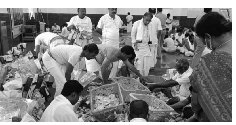
స్వామివారి దర్శించుకుని పునీతులయ్యారు. గ్రాములు మిత్రమువెది 01-970-000 ఒక కేజీ తొమ్మిది వందల డెబ్బై గ్రాములు వచ్చాయని తెలిపారు. విదేశీ రూపాయలు ఆమెరికా - 1,566 డాలర్లు, యూఏఓ - 20 డాలర్లు, ఆస్ట్రేలియా -50 డాలర్లు, జెనడా -100 డాలర్లు, క్యాన్యా -2 రియల్స్, నేపాల్ -5 రూపాయలు న్యూజిలాండ్ -5 డాలర్లు వచ్చాయని ఆలయ ఆధికారులు తెలిపారు.

యాదగిరిగుట్ట, మార్చి 31 (మనం న్యూస్): యాదగిరిగుట్ట శ్రీ లక్ష్మీనరసింహస్వామి సన్నిధిలో సుందర్ పుష్పార్చనలు అందా అమ్మవారికి ఉంజల్ సేవా పర్వాలను శుభవారం శాస్త్రీయంగా కొనసాగాయి. సుప్రభాతంలో స్వయంభులను మేల్కొలిపిన ఆర్చుకులు నిత్య విధి కైకగర్వాల నిర్వహించారు ఆదేవిధంగా ప్రధానాలయంలోని సువర్ణమైన ప్రతిష్ఠ అలంకార కవచమూర్తులను 108 సువర్ణ పుష్పాలతో ఆర్చారు. మూవ రులను అభిషేకించి తులసీ దళాలు కుంకుమలతో సహస్రనామాస్తోత్రం జపించారు. అంతర్వ్యాక రమంటపంలో హోమా, నిత్య కల్యాణోత్సవాలు శాస్త్రీయంగా నిర్వహించారు. కొండపైన ఆసుబంద ఆలయమైన రామలింగేశ్వరుడికి ముఖ మంటపం లోని స్పటిక లింగానికి నిత్య పూజా కైకగర్వాల నిర్వహించారు. సాయంత్రం ప్రధానాలయంలో కొలువుదీరిన ఆండాళ్ అమ్మవారికి అష్టభుజి అంతర్వ్యాకరమంటపంలో ఆండాళ్ అమ్మవారికి ఉంజన్ సేవోత్సవం నిర్వహించారు. సాయంత్రం వెండి ఊడు స్యామివారి తిరువీరులలో తిప్పగా భక్తులు