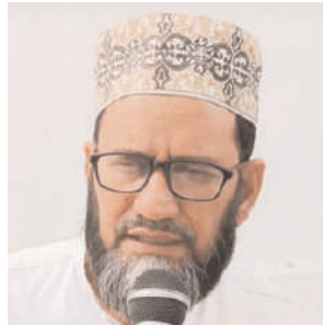
విద్యార్థులకు బస్ సౌకర్యం కల్పించాలని విజ్ఞప్తి చేశారు.

విద్యార్థులు 3 కిలో మీటర్లు దూరంగా గల కిన్నెరసాని ప్రభుత్వ పాఠశాల పరీక్ష కేంద్రానికి వెళ్ళి మండుబండలో పరీక్షలు రాసి కాలినడకన వస్తున్నారని అన్నారు. గత కొన్నేళ్లుగా ఈ ప్రాంతంలో విద్యార్థులు 10వ తరగతి పరీక్షలు రాయడానికి బస్ సౌకర్యం లేక ఇబ్బందులకు గురౌతున్నారని జిల్లా కలెక్టర్ స్పందించి వెంటనే ఈ ప్రాంత విద్యార్థులకు ప్రత్యేకంగా పడవ తరగతి పరీక్షలు రాసి