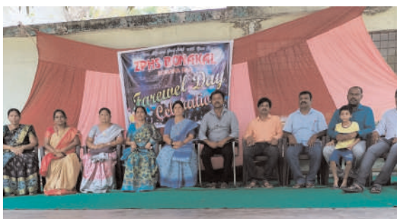
విద్యార్థులకు ఆశీస్సులు అందించారు. పరీక్షలు వ్రాయుటకు సూచనలిస్తూ (ఆల్ ద టెస్ట్) అభినందనలు తెలియజేశారు పరీక్షల నిర్వహణలో ఎవరు భయపడవద్దని బాగా చదువుకొని ధైర్యంగా పరీక్షలను వ్రాయాలని కోరినారు ఈ కార్యక్రమంలో పాఠశాల విద్యార్థిని విద్యార్థులు, స్నేహితులు, తల్లిదండ్రులు పెద్దలు గ్రామ ప్రజలు గ్రామ ప్రజలు తదితరులు పాల్గొన్నారు.