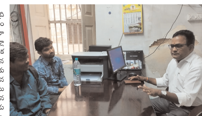
అందించవచ్చన్నారు. ప్రజలు అవకాశాన్ని సద్వినియోగం చేసుకోవాలని కోరారు.